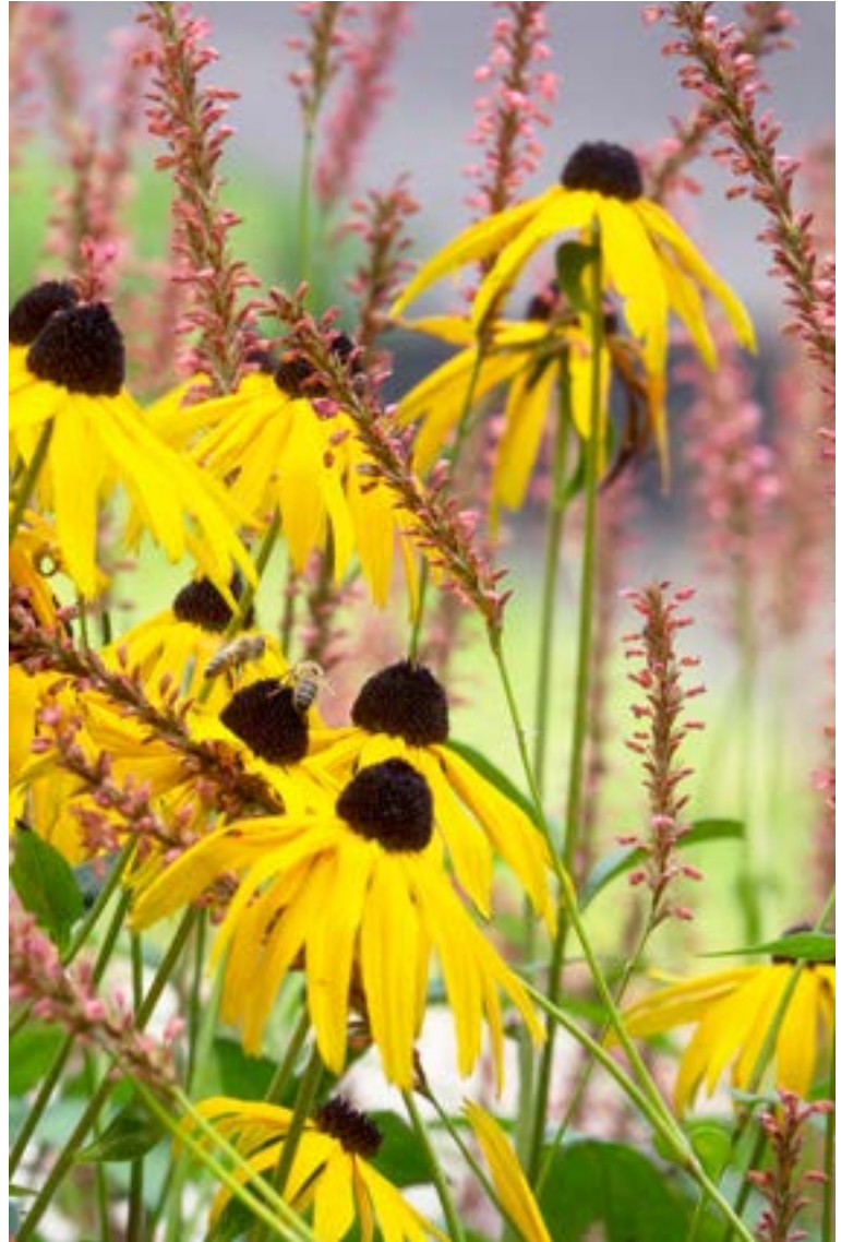
Rudbeckia fulgida 'Goldsturm' met Persicaria affinis (duizendknoop).

volwassen gedeelte naar het meer jeugdige elan van de tuin."